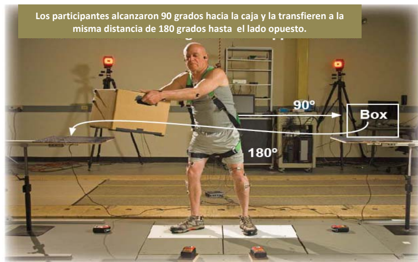
Los participantes alcanzaron 90 grados hacia la caja y la transfieren a la misma distancia de 180 grados hasta el lado opuesto.

En colaboración con la Escuela de Salud Pública de Harvard, reclutamos y observamos de 30 a 45 hombres y mujeres en edades comprendidas entre 18 y 67 años para completar el protocolo del estudio. Sobre un curso de aproximadamente cuatro horas, los participantes