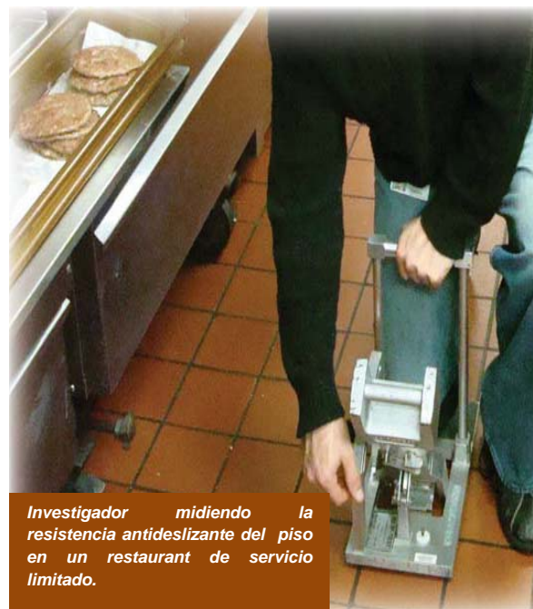
Investigador midiendo la resistencia antideslizante del piso en un restaurant de servicio limitado.

Aprovechando los hallazgos obtenidos de estudios previos realizados por el Instituto, pusimos en marcha un estudio de campo cohorte en cooperación con nuestros colegas de los Centros de Ergonomía Física y Ciencias Conductuales y los socios de investigación de la Escuela de Salud Pública de Harvard. Este proyecto multidisciplinario tiene como objetivo mejorar nuestra comprensión de las causas y prevención de las caídas al mismo nivel. El estudio observa a los empleados de restaurantes de servicio limitado en el trabajo para determinar de qué manera factores tales como: características de la superficie del piso, el calzado anti resbalante, las prácticas de limpieza del piso y el clima de seguridad, así como los factores de riesgos transitorios, como la distracción y la prisa, representan un riesgo de resbalar.